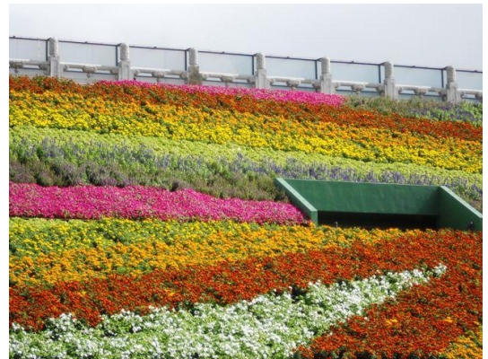
中山足球場內的七道彩虹