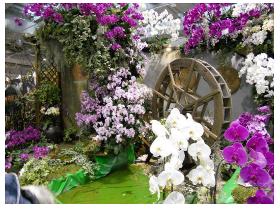
爭豔館裡美麗的台灣阿嬤