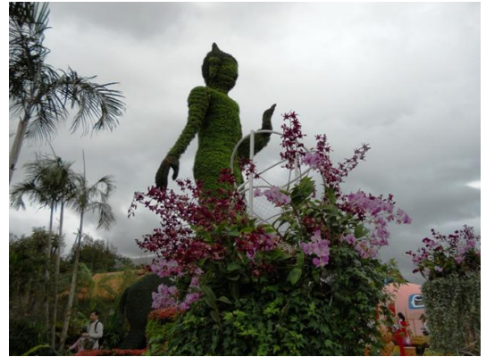
寰宇庭園區的泰國館

(欲看更多美麗的照片，請上網瀏覽楊遠薰部落格: http://tw.myblog.yahoo.com/overseas-tw )。